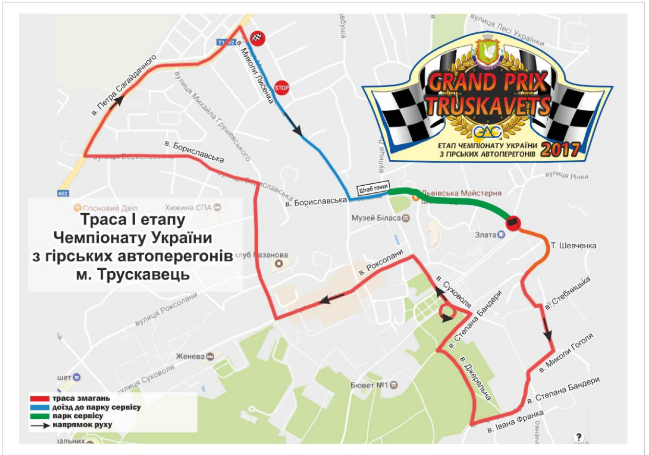
СХЕМА ТРАСИ ЗМАГАННЯ «ГРАН-ПРІ ТРУСКАВЦЯ» (м.Трускавець, міська траса)